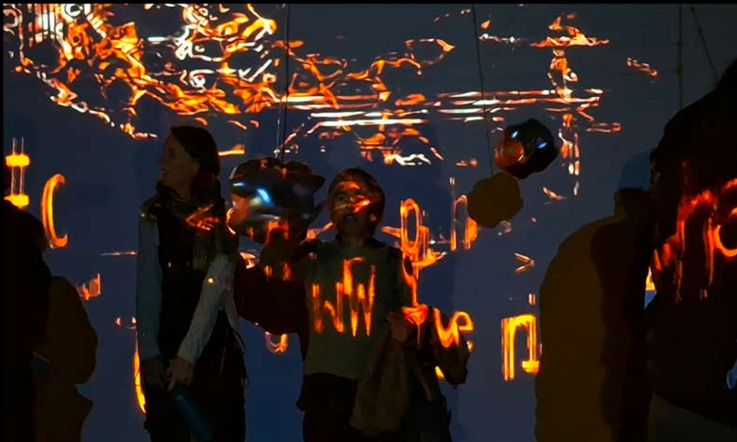
Photographie de la création mondiale/vernissage du concert/installation

AKADEMIE DER KÜNSTE (Berlin-DE), 5 novembre 2025