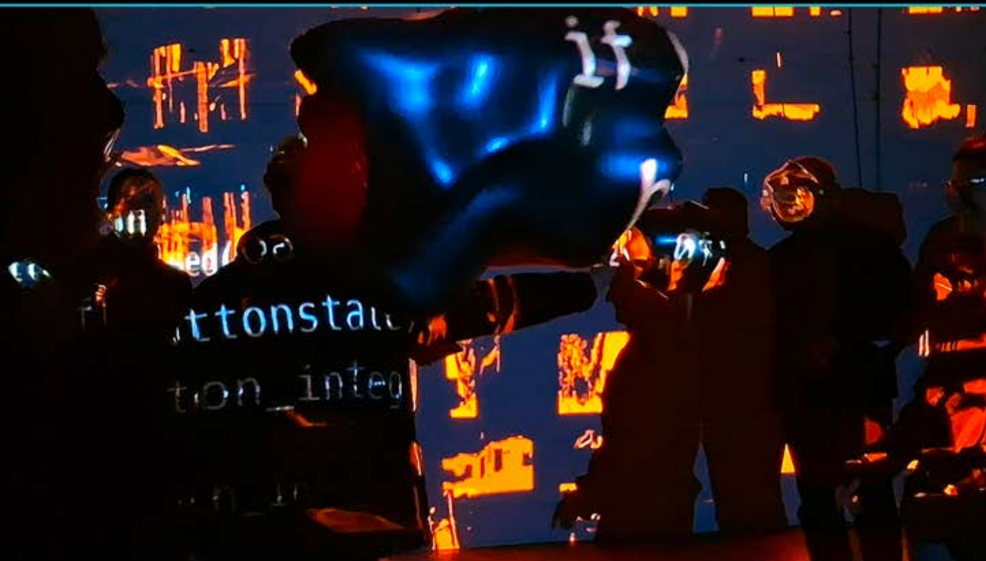
Photographie de l'installation - AKADEMIE DER KÜNSTE (Berlin-DE) - Public en interaction avec les objets